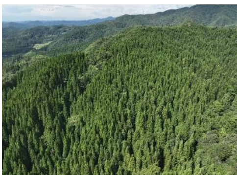
ドローンを使って撮影した公社林