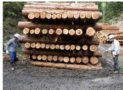
間伐材の検尺状況