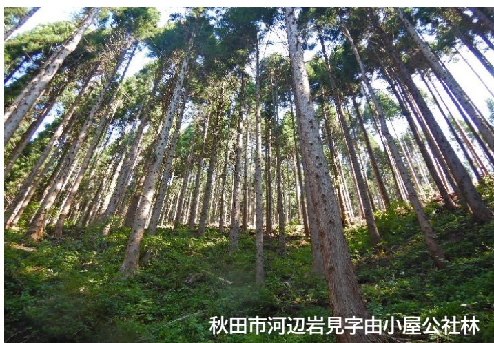
秋田市河辺岩見字由小屋公社林

さて、去る6月に開催されました理事会及び評議員会におきまして、令和5年度事業報告ならびに収支決算が承認されましたので、概要を報告いたします。